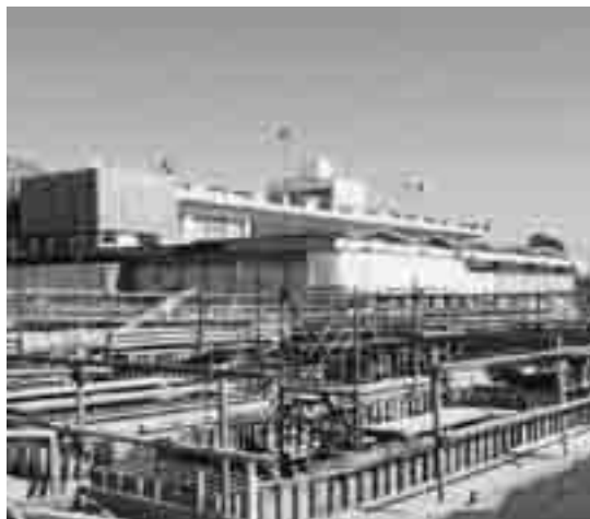
庁舎南西から(3月11日現在)