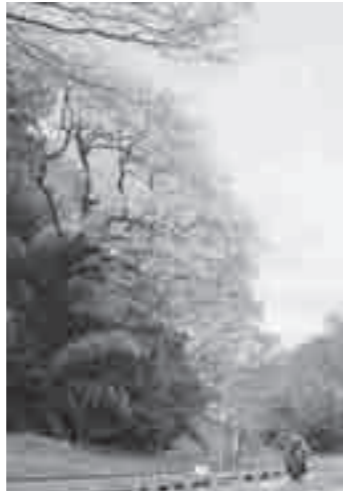
北本自然観察公園のエドヒガンザクラ