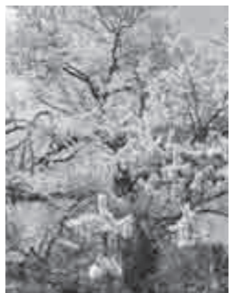
阿弥陀堂のエドヒガンザクラ