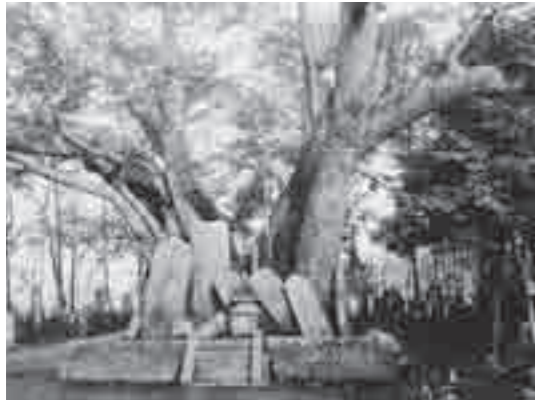
大正時代の蒲ザクラ 天然記念物指定当時の蒲ザクラの様子が伺えます。当時は枝張りが30mにもおよび現在の1.5倍の大きさがありました。