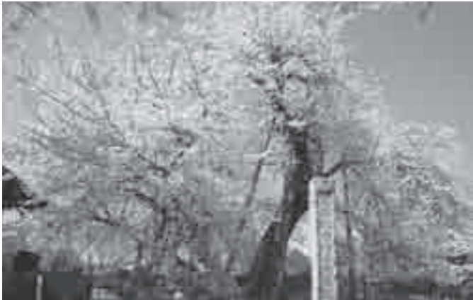
東光寺の石戸蒲ザクラ

東光寺の境内にある石戸蒲ザクラは、日本五大桜に数えられる名木で、大正11年に国の天然記念物に指定されました。4月上旬に、白く可憐な花を咲かせます。