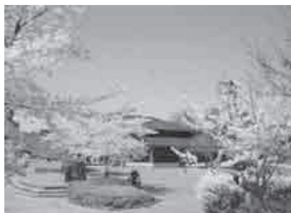
野外活動センター

野外活動センターにはキャンプ場や芝生広場、体験学習室などがあり、家族・団体等がレクリエーションを楽しみながら桜を楽しむことができます。