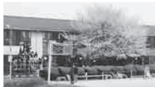
石戸小学校の蒲ザクラ 植えられてから18年ほどですが、見事な大木に成長しました。