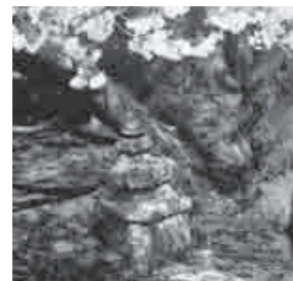
源範頼の墓標と伝えられる石塔

源範頼の墓標と伝えられる石塔 たため蒲冠者と呼ばれていました。蒲ザクラは範頼を追慕する桜としてその名前を冠しているのです。