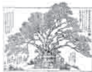
渡辺華山の描いた蒲ザクラ 東光寺境内へ石段を登った辺りから見た構図であると思われ。根元から幹が7本に分かれ扇のように広がる樹形が描かれています。