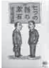
七つの顔の漱石 出久根達郎 (晶文社)