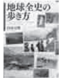
地球全史の歩き方 白尾 元理 (岩波書店)