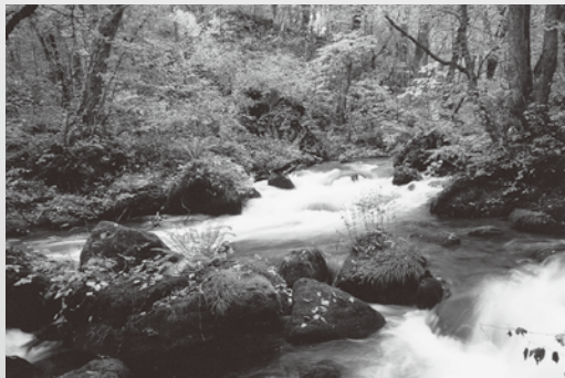
「奥入瀬溪流」 島貴秀雄さん(光彩写真クラブ)