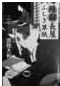
☐鯖猫長屋ふしぎ草紙 田牧 大和 (PHP 研究所)