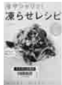
☐冷やシャリッ! 凍らせレシビ チーム凍らせレシビ (メディアファクトリー)