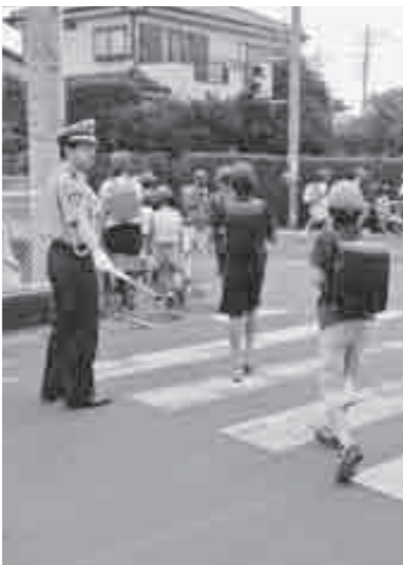
朝の登校を見守る交通指導員。雨の日も風の日も子どもたちの安全を守ります。

10月16日(水)には女性・高齢者向け交通安全教室が20周年記念での実施となります。なお、当日は交通安全母の会と協賛で自転車教室を開催する予定です。