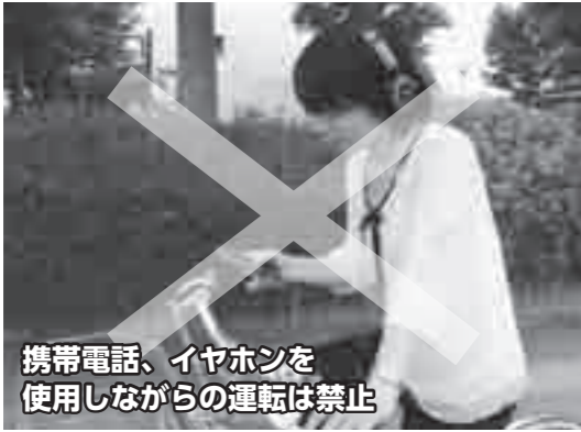
携帯電話、イヤホンを使用しながらの運転は禁止