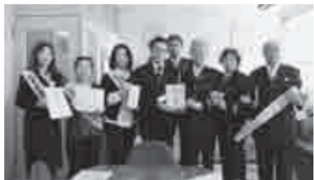
交通安全協会の黄色傘、交通安全母の会のランドセルカバー、反射材贈呈の様子