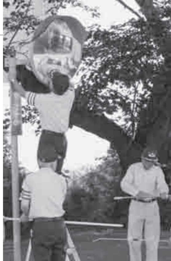
交通安全協会によるカーブミラーの清掃。目に見えないところで動いてくれている人たちがいます。