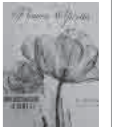
フラワースピリッツ スティーブン・N.メイヤーズ(グラフィック社)

人口のうごき 人口…69,106人(-32人) 男性…34,415人(-21人) 女性…34,691人(-11人)