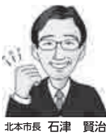
北本市長 石津 賢治

145年前、五箇条の御誓文に示された、新しい国づくりを目指す明治政府の基本方針の第一は、「広く会議を興し、万機公論に決すべし」でした。明治時代と同様に先行きが不透明な中、さまざまな困難を乗り越えていくためには、幅広い市民の知恵と力が必要です。 今年度の「きたもと市民会議」は9月から11月の3か月間開催し、市のホームページから参加できます。ぜひご協力をお願いします。