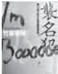
襲名犯 竹吉 優輔 (講談社)