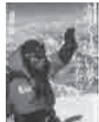
高く遠い夢ふたたび 三浦 雄一郎 (双葉社)