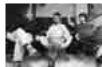
TRIO THE RIDDIMATES