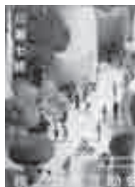
□桃ノ木坂互助会 川瀬 七緒 (徳間書店)