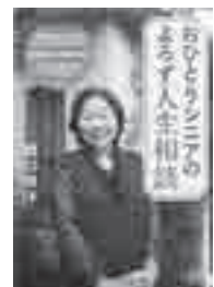
□おひとりシニアの よるず人生相談 樋口 恵子 (主婦の友社)