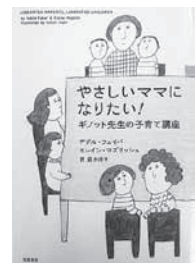
☐ やさしいママになりたい! アデル・フェイバ/エリン・マズリッシュ(筑摩書房)