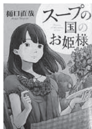
☐ スープの国のお姫様 樋口 直哉(小学館)