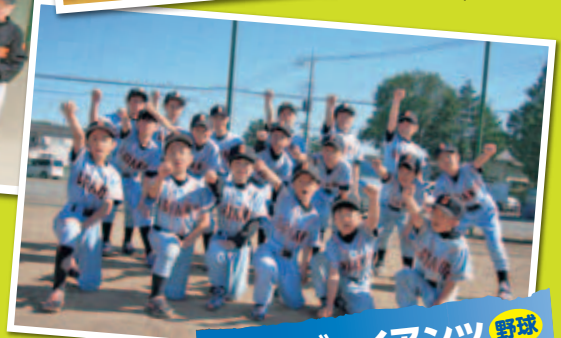
リトルジャイアンツ 野球