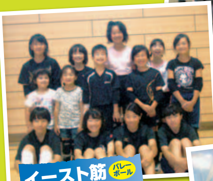
イースト筋 バレーボール