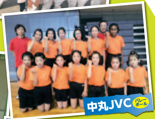
中丸JVC バレーボール