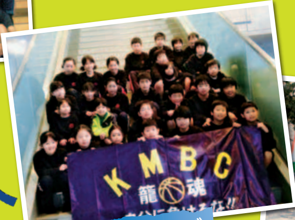
北本ミニバスクラブ