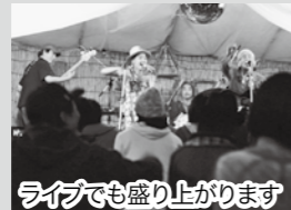
ライブでも盛り上がります