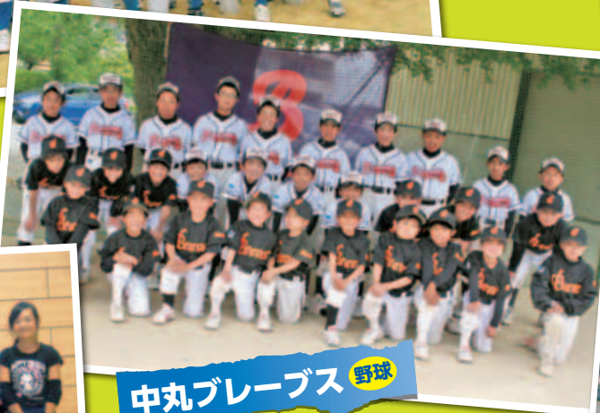
中丸ブレーブス 野球