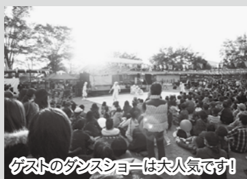
ゲストのダンスショーは大人気です!