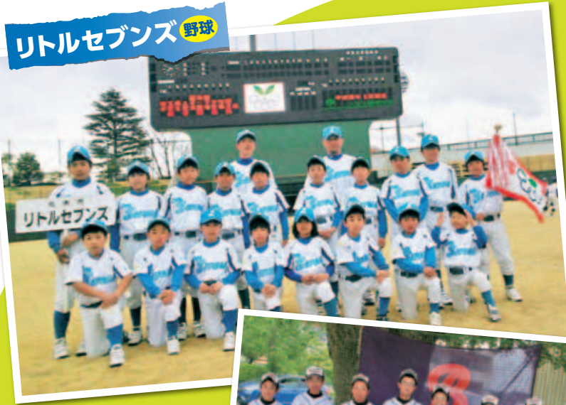
リトルセブンス 野球