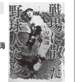
●戦場に散った 野球人たち 早坂 隆 (文藝春秋)

人口のうごき 人口…68,723人(-14人) 男性…34,227人(-10人) 女性…34,496人(-4人)