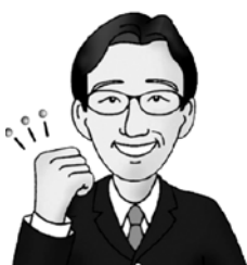
北本市長 石津 賢治