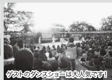
ゲストのダンスショーは大人気です!