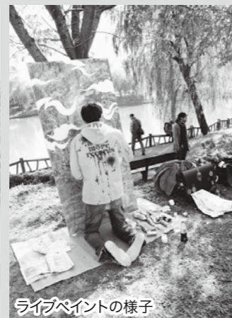
ライブペイントの様子