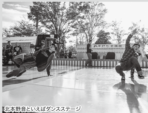
北本野音といえばダンスステージ