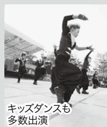
キッズダンスも多数出演