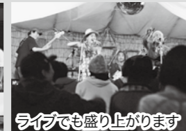
ライブでも盛り上がります