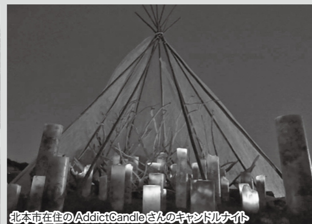
北本市在住のAddictCandleさんのキャンドルナイト