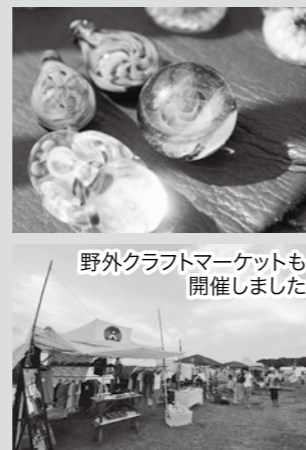
野外クラフトマーケットも開催しました