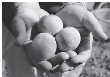
食べる人のことを考えてつくら れたプラム。自然の甘みが口に 広がり、体も心も元気になる。

の肥料を使っています。 特に、ウコンと梅干しは 材料からつくり加工して いるため、すべてが北本 産です。 後継者へのアドバイ スを伺うと、 「農業というのは自分で 学ぶものです。一から教 えて、と言われても、つ くる土地によっても向き 不向きがあるので一概に 教えることはできません 。最終的にはライバル になりますし。それでも、 一生懸命やって、壁に当 たって、自分から学ぼう とする人には、惜しみな く助言するつもりです」 と語ってくれました。