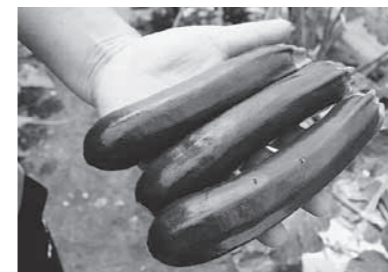
花を育てた手がつくからか、ズ ッキーもつやつやと美しい。同じハ ウスで栽培するオクラの花も立派 に咲いており、「天ぶらにしたらさ れいだし、おいしいかも」とのこと。

ね。栽培のメインはネギ にしようと思っていま す。ネギもユリと同じ科 なので、得意科目かな つて。」 後継者育成について伺 うと、「ユリについては 教えられるけど、野菜は 教えてもらう方が多いか な。もっと、情報交換の 場が増えればいいです ね。手が足りなくなっ たときはみんなで補えるよ うな、団結できる新しい 農業の形態もこれから必 要だと思います」 花も野菜も、将来はど ちらも栽培できるオー ラウンダーをめざしてい ます。