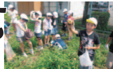
生徒は体験を通して、農作物のつくり方、収穫の喜びなど、机の上だけでは学べないことを学んでいます。