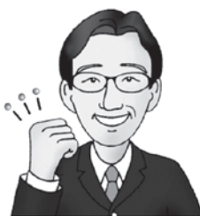
北本市長 石津 賢治

ご当地レトルトカレーは数百種類あると言われ、カレーの戦いは味同様なかなか甘くはありませんが、観光協会とともに全国に北本をアピールしてまいります。