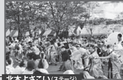
北本よさこい(ステージ) 11月8日 土 10:00~15:00