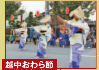
越中おわら節 (おわら友の会)