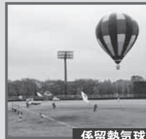
係留熱気球 11月8日 土 10:00~15:00