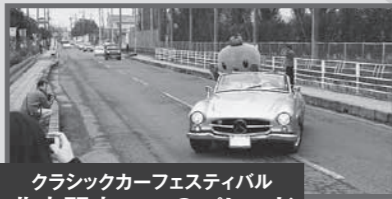
クラシックカーフェスティバル 北本駅東口へのパレード 11月9日 日 11:00~/11:30~