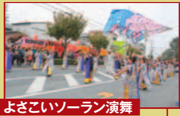
よさこいソーラン演舞