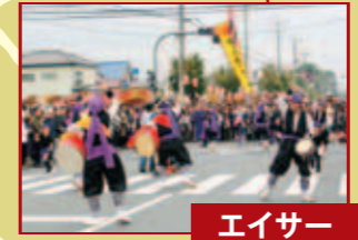
エイサー(ていたエイサー隊)