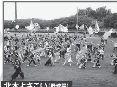
北本よさこい(野球場) 11月8日 土 10:00~15:00