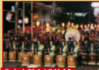
北本太鼓かばざくら