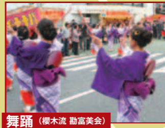
舞踊(櫻木流 勲富美会)