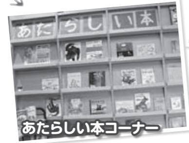
あたらしい本コーナー