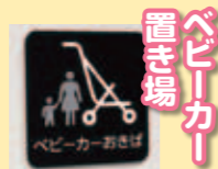
ベビーカー置き場