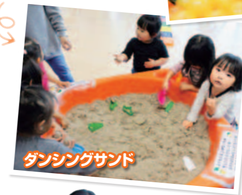
ダンシングサンド