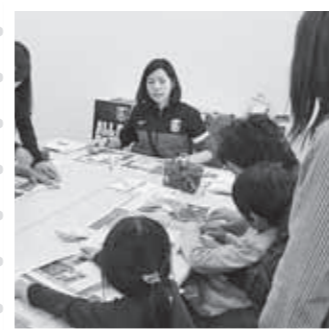
浦和レッズの「シャーレくん」