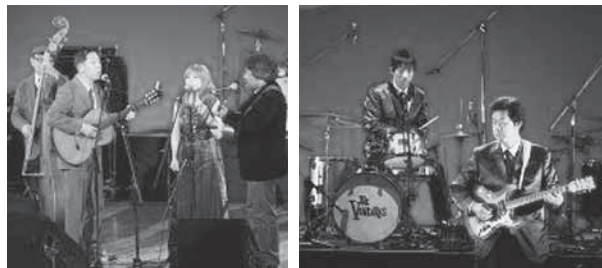
開きたもとアマチュアバンドフェスティバル実行委員会 (生涯学習課 ☎594-5567)