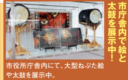
市庁舎内で絵と太鼓を展示中! また、昨年と同様に、弘前市から本場ねぶた囃子の応援や、太田市の上州ねぶた会の参加などもあり、宵まつりを大いに盛り上げます。