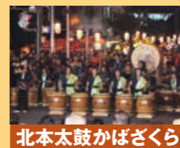
北本太鼓かばざくら