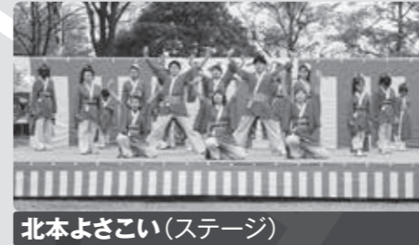
北本よさこい(ステージ) 11月15日(日) 10:30～15:30