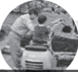
ユンボの運転体験 11月14日(土)・15日(日) 10:00～15:00