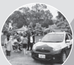
パトカー・白バイの展示 11月14日(土) 10:00～15:00