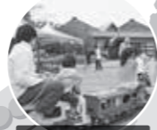
電気機関車 11月14日(土) 10:00～15:00