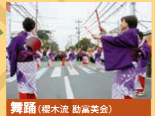
舞踊(櫻木流 勸富美会)