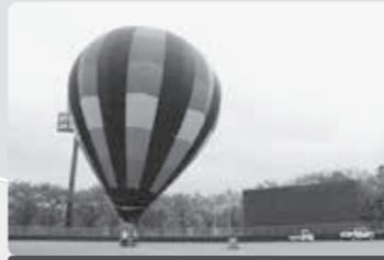
係留熱気球 11月15日(日) 10:30～15:30