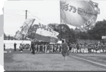
北本よさこい(野球場) 11月15日(日) 10:30～15:30