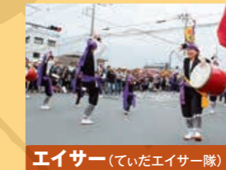
エイサー(ていだエイサー隊)