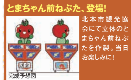
とまちゃん前ねぶた、登場! 北本市観光協会にて立体のとまちゃん前ねぶたを作製。当日お楽しみに!