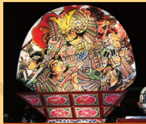
範頼ねぶた 2号機(源範頼一ノ谷に勇戦の図)

範頼号は2台とも、北本ゆかりの武将、蒲ザクラでおなじみの「源範頼」が描かれています。絵師はどちらも弘前ねぶたを代表する絵師「三浦香龍」氏です。今年の新作でもある、範頼1号の鏡絵の題名は「源義経、範頼と共に平家を討つ」です。ぜひご期待ください!