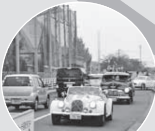
北本駅東口へのパレード 11月14日(土) 11:00～11:30