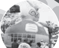
ふわふわドーム 11月14日(土)・15日(日) 10:00～15:00