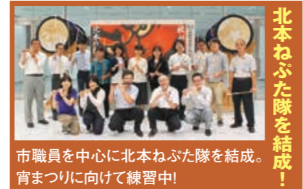
市職員を中心に北本ねぶた隊を結成。宵まつりに向けて練習中!