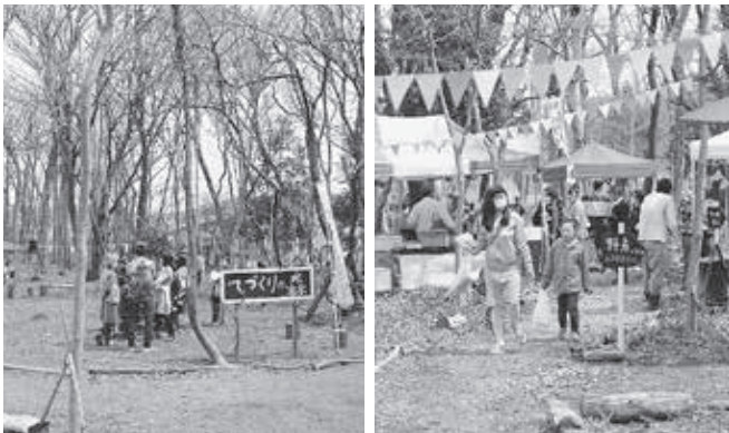
▲昨年の「てづくりの森」の様子

当日は各会場をつなぐ無料シャトルバス(1時間に1本程度)もご用意しています。休日のお散歩・ピクニック気分ぜひお出かけください。