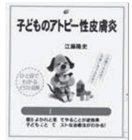
子どものアトピー性皮膚炎正しい治療法 江藤 隆史 (講談社)