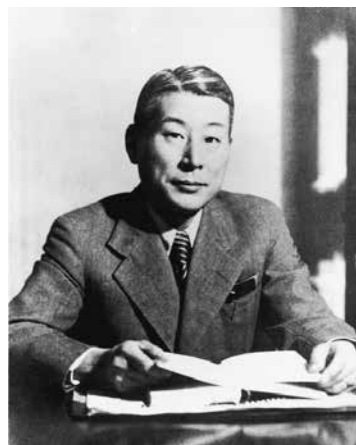
「NPO杉原千畝命のビザ」