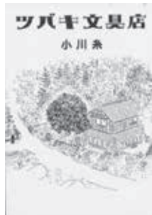
ツバキ文具店 小川 糸 (幻冬舎)