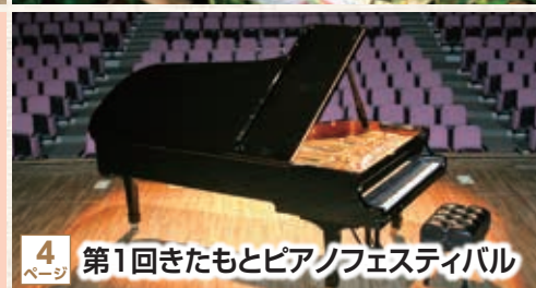
4 ページ 第1回きたもとピアノフェスティバル