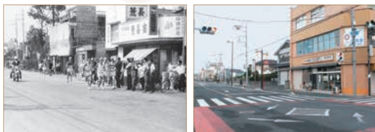
多間寺交差点付近 (左:昭和42年 右:現在) :昭和42年5月14日に大宮から鴻巣までの中山道で、国民体育大会秋季大会のリハーサルが行われました。