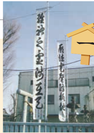
本宿天神社の「算額」・「幟」

南には桶川宿があり、北へ向かうと鴻巣宿へ到達します。北本市域はこれらの宿場に挟まれた「間の宿(あいのしゅく)」としてありました。北本市域はこれら江戸時代では、中山道は南から下石戸下村、下中丸村、本宿村、東間村、深井村を貫いていました。