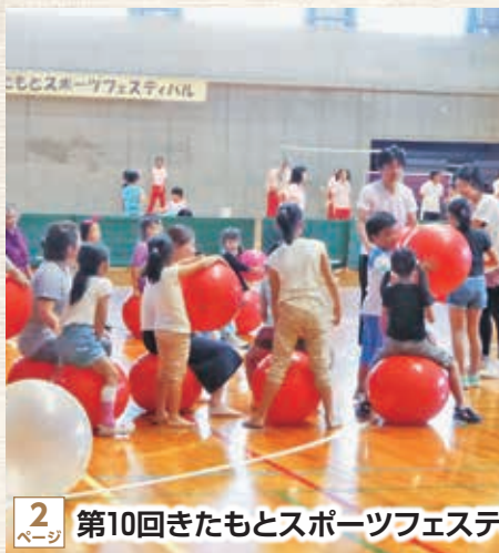
2 ページ 第10回きたもとスポーツフェスティバル