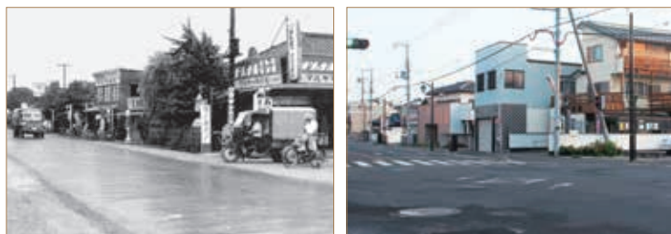
北本駅付近(東口ほぼ中央) (左:昭和30年 右:現在)