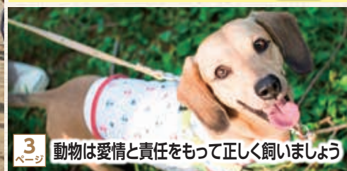
3 ページ 動物は愛情と責任をもって正しく飼いましょう