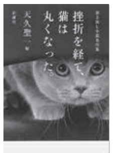
挫折を経て、 猫は丸くなった。 天久 聖一 (新潮社)