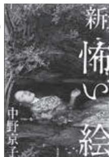
新怖い絵 中野 京子 (KADOKAWA)