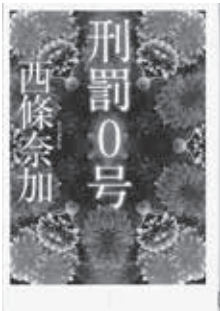
刑罰0号 西條 奈加 (徳間書店)