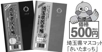
埼玉県マスコット「さいたまっし」

☎場申☎10月18日(火)～12月16日(金)に企画課企画統計担当(☎594-5516)へ代金を添えてお申し込みください。