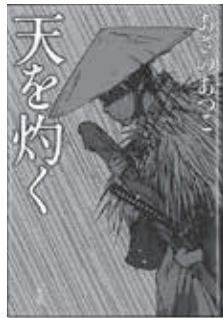
天を灼く あさの あつこ (祥伝社)