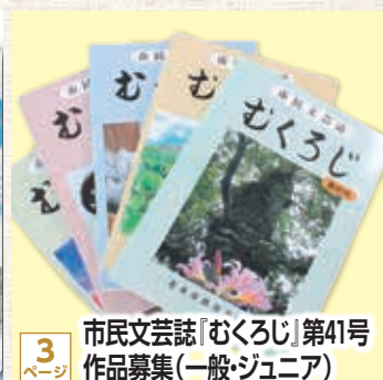
3 ページ 市民文芸誌「むくろじ」第41号 作品募集(一般・ジュニア)