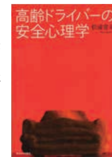
高齢ドライバーの安全心理学 松浦 常夫 (東京大学出版会)