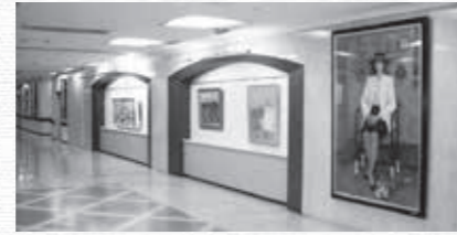
北里大学メディカルセンター内に飾られているヒーリングアート

私はよく「他人の真似をしない。他人の真似をしたら、その人を超越することはできない」と言っています。が、病院の建設も同じで、普通の病院とは違うヒーリングアートのある病院にしたいと思ひ、多くの皆さんの御協力により絵画をそろえ、患者や家族、病院で働く人々のために癒しの空間を用意しました。この病院は格別なので、大事にしたい。だき、大いに活用していただき、皆さんの健康維持に役立てることができれば、この上ない喜びです。今後とも北本市の皆さんに愛され、誇りに思っていただけのような病院にすべく、心掛けていきたいと思ひます。どうぞ、よろしく願ひいたします。