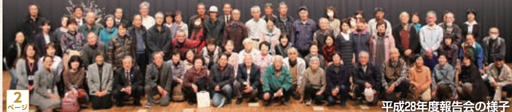
平成28年度報告会の様子

平成29年度「もっと歩こう もっと知ろう きたもと ～めざせ!毎日1万歩運動～」新規参加者を募集します!