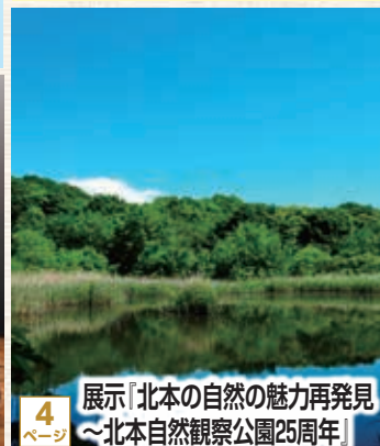
4 ページ 展示「北本の自然の魅力再発見 ～北本自然観察公園25周年～」