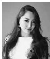
たかの ゆりえ 高野 百合絵 (メゾ・ソプラノ)