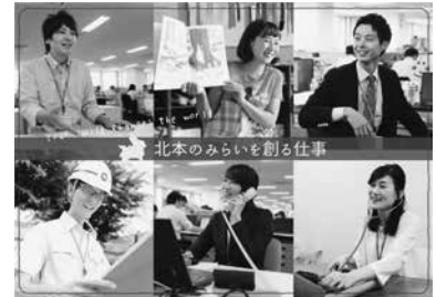
北本の未来を創る仕事