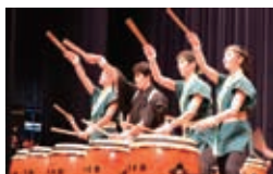
オープニングアトラクション