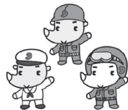
自衛隊 埼玉地方協力本部 ゆるキャラ「サイボン」