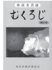
市民文芸誌 『むくろじ』第41号