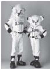
レオ ライナ 球団マスコット