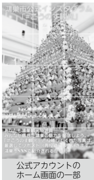
公式アカウントの ホーム画面の一部