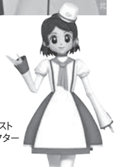
グリコピア・イースト マスコットキャラクター ピアーナちゃん