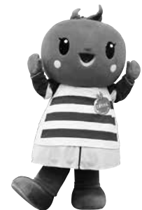
ゆる玉フィフティーン とまちゃん

問 埼玉県県民生活部ラグビーワールドカップ2019大会課(☎048-830-6870)