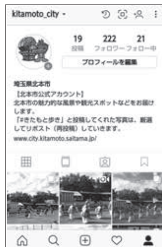
北本市公式アカウント [kitamoto_city] (埼玉県北本市)