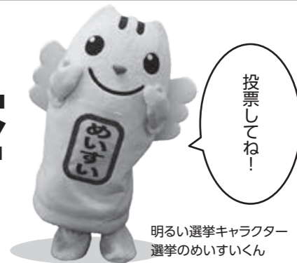
明るい選挙キャラクター 選挙のめいすいくん