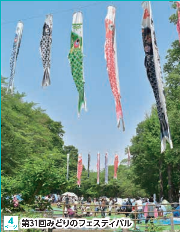
4ページ 第31回みどりのフェスティバル