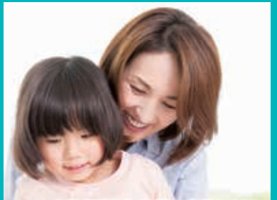
7ページ 病後児保育事業の新規登録 および継続申請の受付