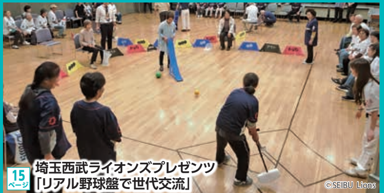
15ページ 埼玉西武ライオンズプレゼンツ 「リアル野球盤で世代交流」