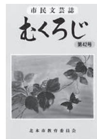
市民文芸誌 『むくろじ』第42号