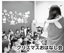
クリスマスおはなし会