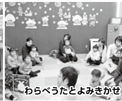
わらべうたとよみきかせ