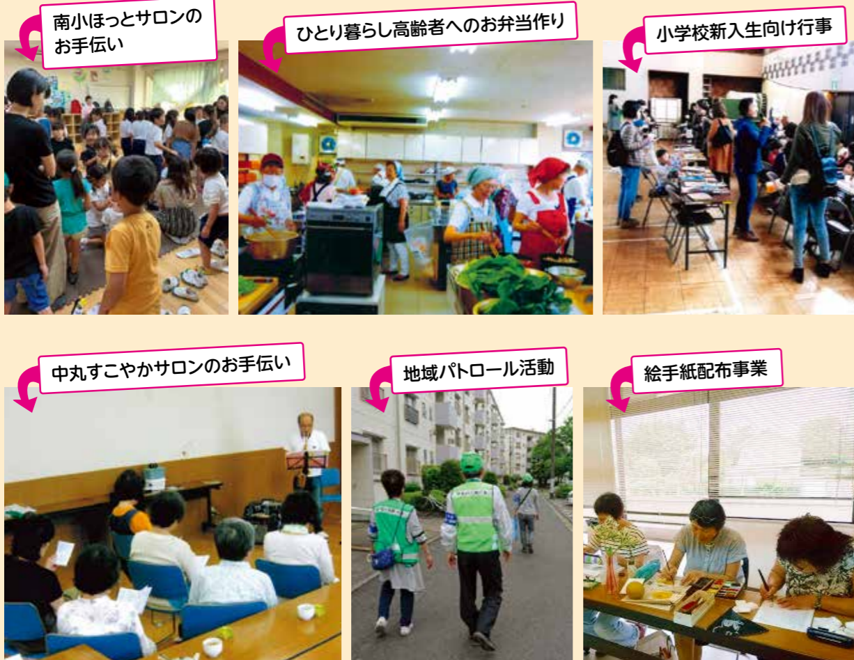
南小ほっとサロンのお手伝い