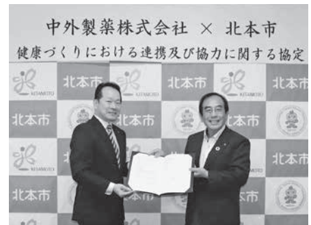
令和元年8月19日 協定締結