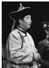
オット・ホンバイラ

時 4月17日(金)14:30~16:00 内 伸びやかな歌声(オルティンドー・長歌)のオット・ホンバイラの演奏会。モンゴル民謡から日本民謡・童謡をお楽しみください。 定 120人 費 全席自由800円 申 文化センター窓口にて発売中。