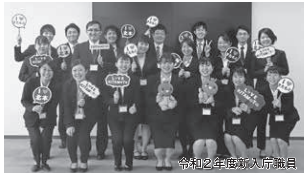
令和2年度新入庁職員