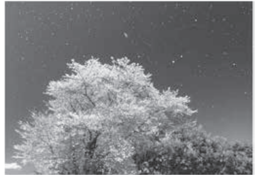
第4回きたもと写真コンクール テーマ②北本市 おびつみつぶ 北本市長賞受賞作品「花嵐」 帯津光信