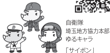
自衛隊 埼玉地方協力本部 ゆるキャラ 「サイボン」