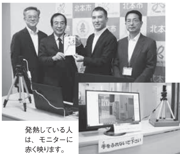
発熱している人は、モニターに赤く映ります。

児童館・こども図書館にサーマルカメラを設置し、発熱の疑いがある人を検知することで、新型コロナウイルス感染症から子どもたちを守ります。このサーマルカメラは株式会社サイオー様から寄贈していただきました。本当にありがとうございます。