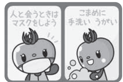
インプラス株式会社様が無償で作成

時 10月7日~11月11日の水曜日(全6回)9:30~11:30 内 囲碁で脳トレと仲間づくり 対 初心者および市内在住・在勤の人 定 10人 費 200円(全6回分) 場 申9月9日(水)9:00から参加費を添えて西部公民館(☎591-0410)へ直接。