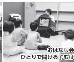
おはなし会 ひとりで聞ける子むけ