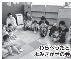
わらべうたとよみかかせの会