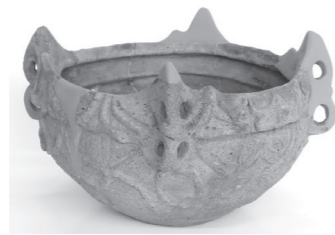
クモがデザインされた浅鉢形土器