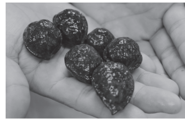
出土した縄文時代のクルミ

遺跡の価値や魅力を市民の皆さんに知っていただくため、様々な展示物を用意しています。ぜひご来場ください。