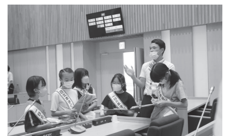
議場についての説明を受ける様子▶