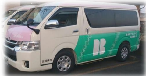
1・2号車 トヨタ ハイース (ウェルキャブ)