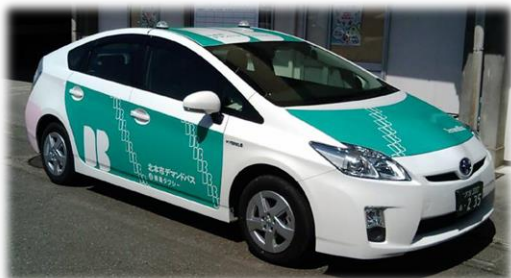
3・4号車 トヨタ プリウス (L)