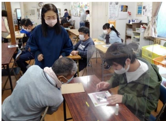
みんなでアルバム教室