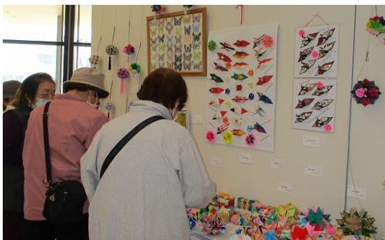
「地域コミュニティ合同作品展」

私たち北本市コミュニティ協議会は、平成26年4月1日から指定管理者として市内に8館ある地区公民館等の管理運営を担っています。それぞれの館を拠点にして地域活動をしている地域コミュニティ委員会と連携しながらコミュニティ活動の推進を図るため活動を行っています。