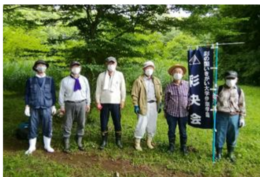
北本自然観察公園で下草狩りのボランティア活動