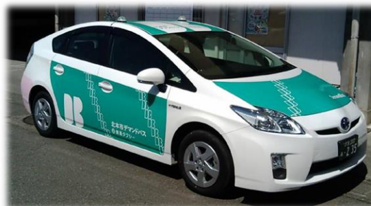
3・4号車 トヨタ プリウス (L)