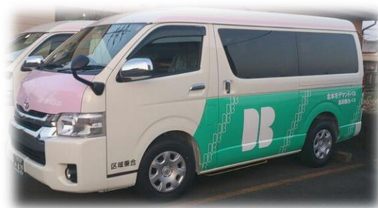
1・2号車 トヨタ ハイエース (ウェルキャブ)