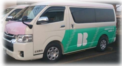
1・2号車 トヨタ ハイエース（ウェルキャブ）