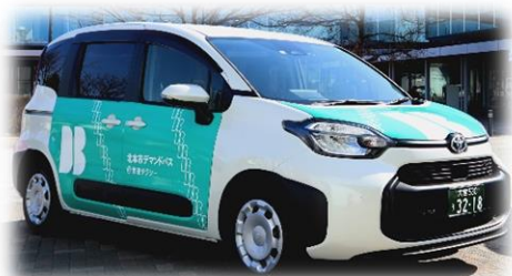
3・4号車 トヨタ シエンタ